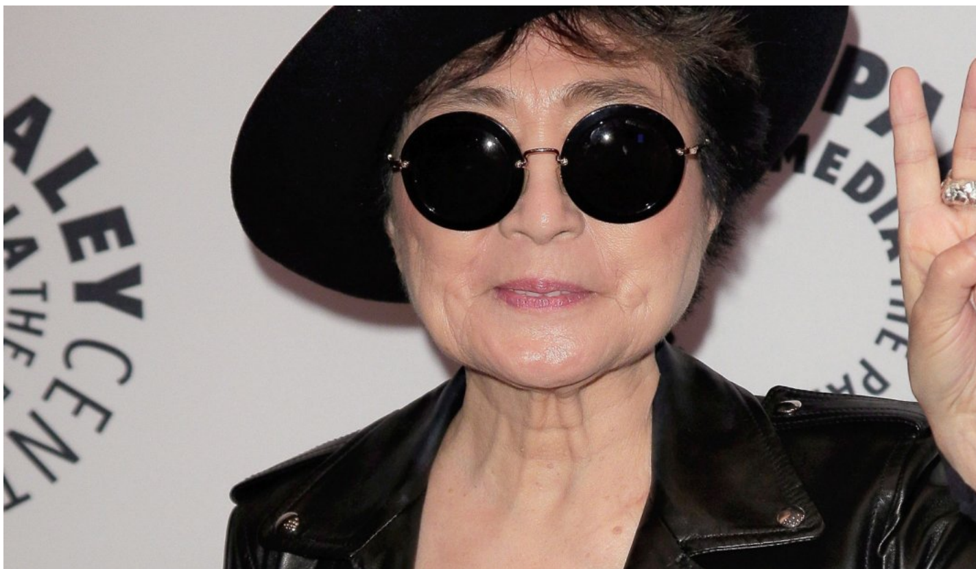
Arte, Cultura & Spettacoli