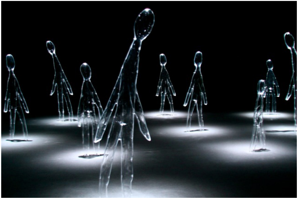
Palermo: ecco Invisible People di Yoko Ono, dedicata al viaggio dei migranti

Finestre sull'Arte - testata giornalistica registrata presso il Tribunale di Massa, aut. n. 5 del 12/06/2017. Società editrice Danae Project srl . Privacy