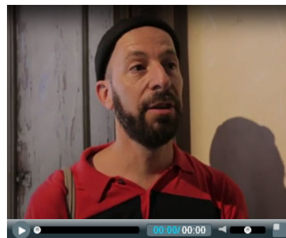
Intervista a Uriel Orlow, autore di "Wishing Trees" (2018), Manifesta 12, Palazzo Butera, Palermo