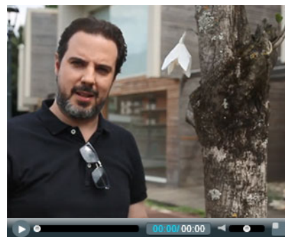
Bocsy Bar di Luca Rossi nell'ambito delle residenze BoCS Art cura di Giacinto Di Pietrantonio