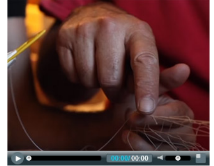
Tutto l'inizio, la fine guarda tutti i video su Exibart.tv»