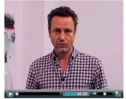
Sebastiano Mauri alla regia di Favola, film di Filippo Timi

INVISIBLE PEOPLE presentata in anteprima mondiale in occasione di OPEN 20. Esposizione Internazionale di Sculture ed Installazioni ideata da Paolo De Grandis parallelamente alla Mostra Internazionale d'Arte Cinematografica, sarà visitabile a Palermo fino al 19 agosto.