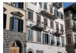
CASA DI TOMMASEO LA DANTE FIRENZE