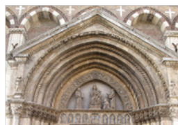
PORTALE DI SAN LORENZO TEMPIO DI SAN LORENZO